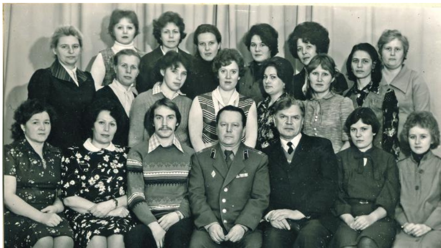
Коллектив представительства заказчика, 1970-е годы

И пятьдесят лет назад, и в наши дни к выпускаемым изделиям, предназначенным для использования в спецтехнике, ведомство военной приемки предъявляет жесткие требования: высокие показатели качества, строгое соблюдение сроков производства и технико-экономическое обоснование затратных механизмов. Поэтому на коллектив военного представительства ложится большая ответственность за контроль выполнения предъявляемых требований. Залогом достижения необходимых результатов